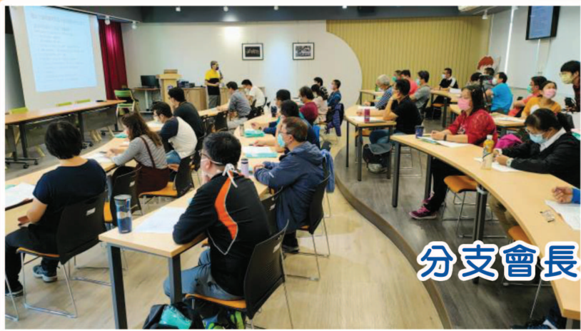
分支會長會議-崇實高工實穗講堂