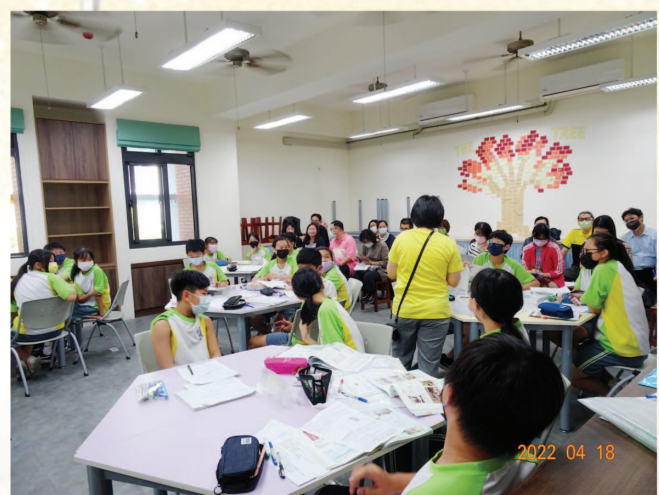
基地班公開觀議課