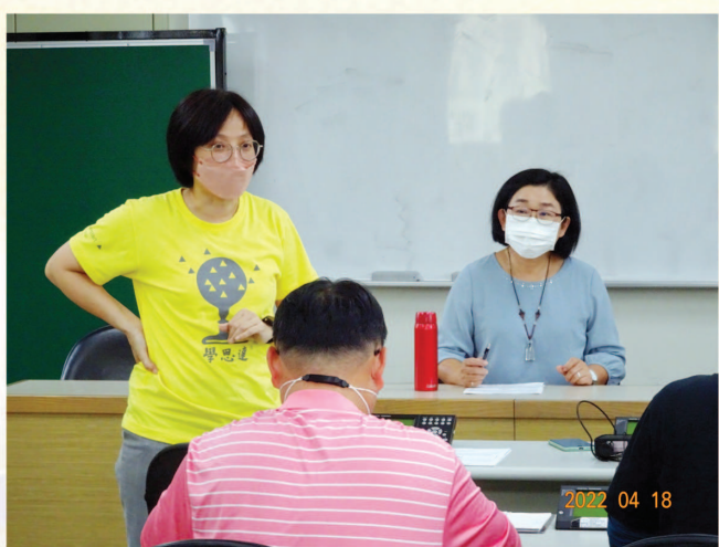
基地班公開觀議課