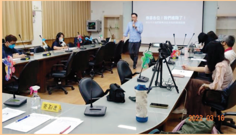
閱讀理解研習-和美實驗學校