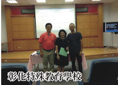
彰化特殊教育學校