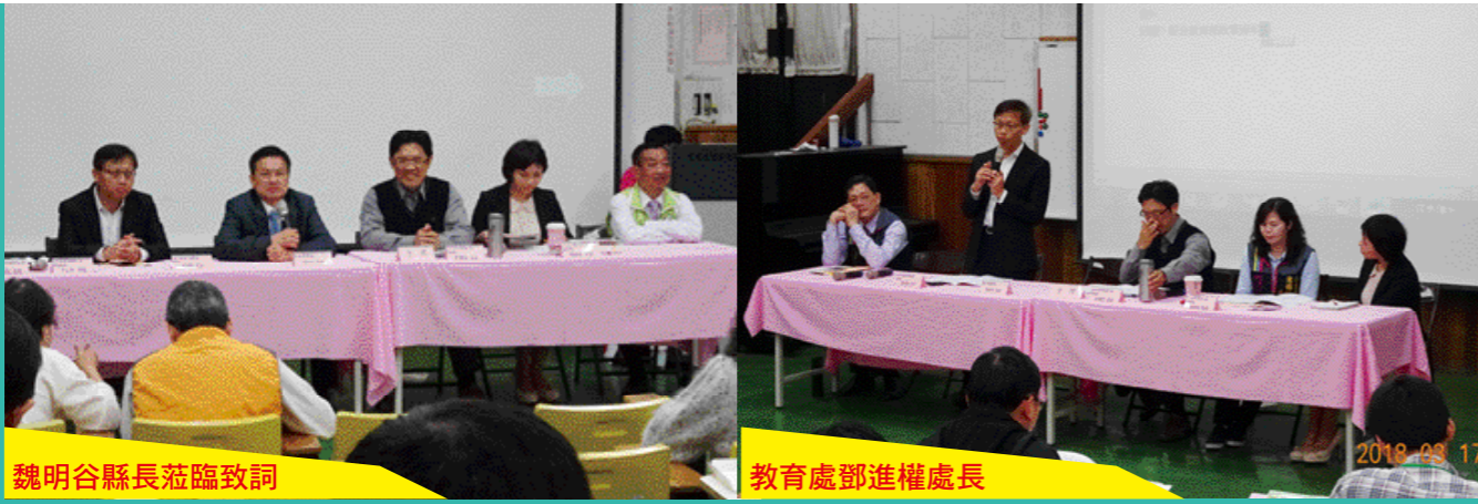
魏明谷縣長蒞臨致詞