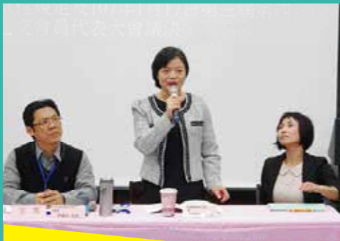
勞工處吳梅蘭處長