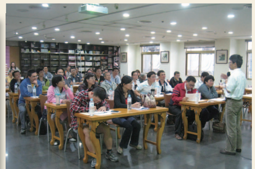
101年10月31日 - 全縣理事長會議 (員林佛光山講堂)