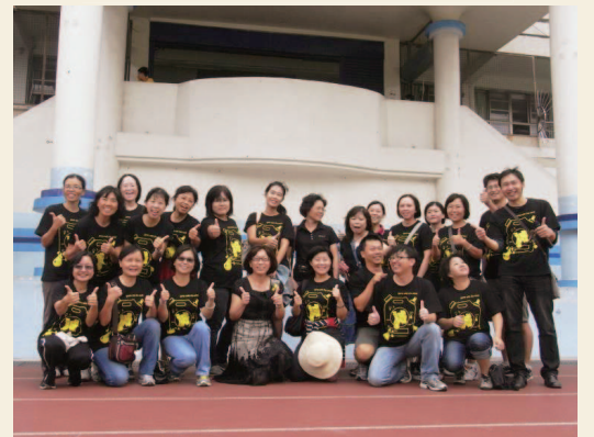
101年9月28日 - 團結 928 (大竹國小)