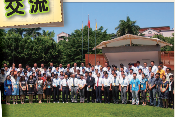
101年5月21日 - 兩岸素質交流研討會 (員林家商)