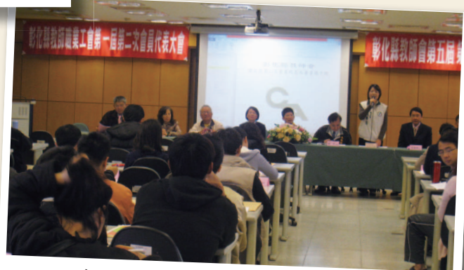
101年3月10日 - 會員代表大會 (溪湖高中)