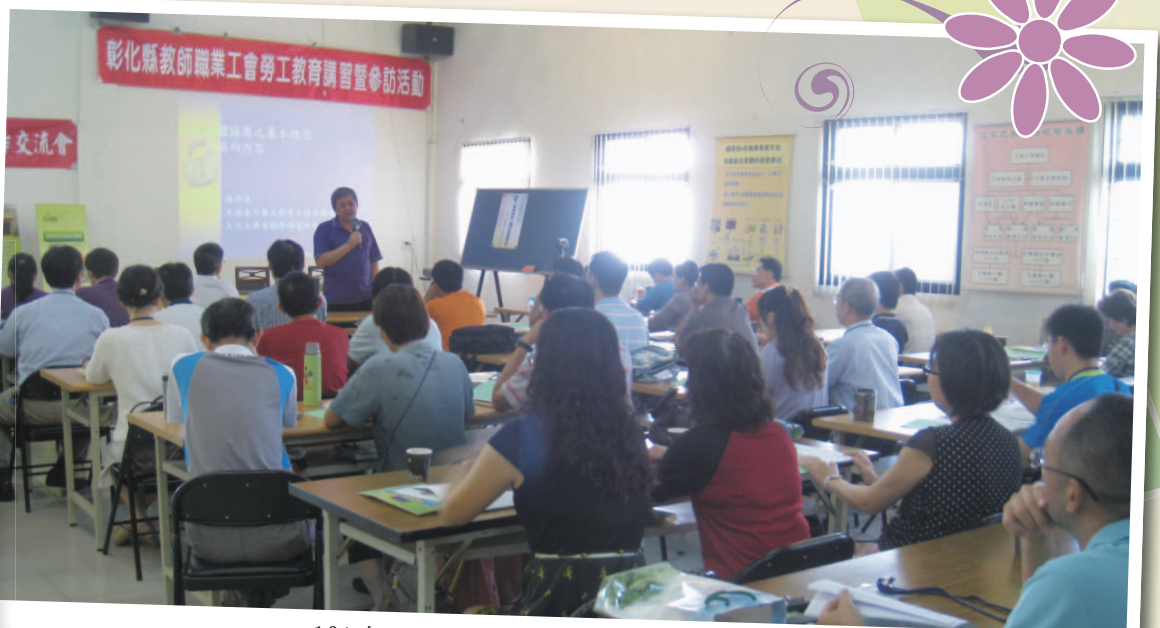
101年7月2日 - 勞動三法研習 (花壇艾草之家)