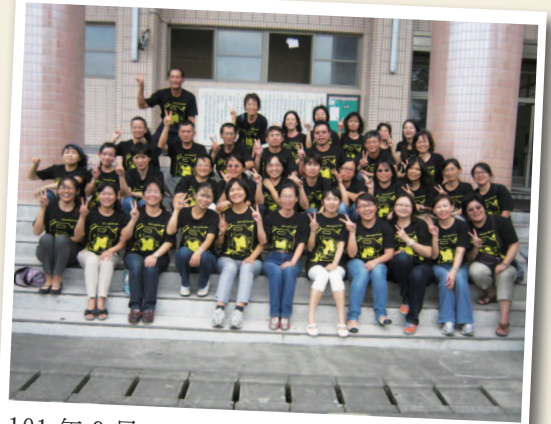
101年9月28日 - 團結 928 (中山國小)