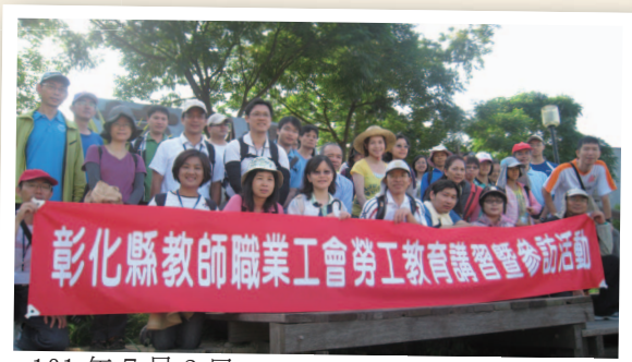
101年7月3日 - 勞動教育研習參訪 ~ 台中市教師職業工會 (台中大坑步道)