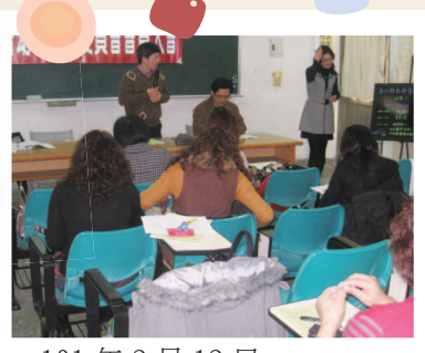
101年2月12日 - 幼教委員會會員大會 (員東國小)