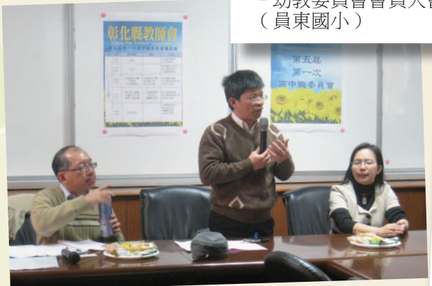
100年12月28日 - 高中職委員會會議 (彰化高商)