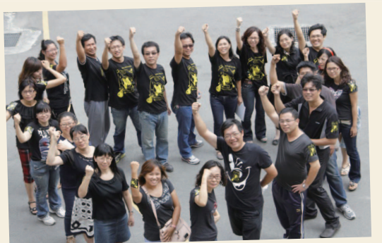
101年9月28日 - 團結 928 (忠孝國小)