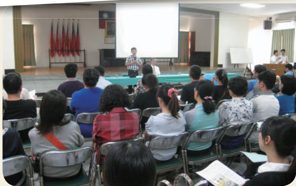
101年10月24日 - 法治教育 (彰化地方法院)