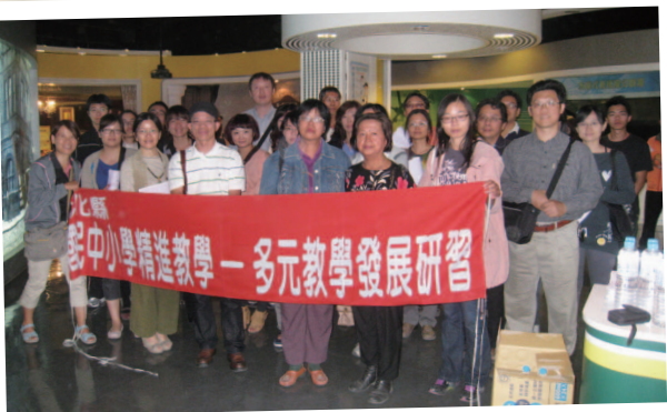
101年11月7日 - 文化產業研究 (台灣玻璃館·白蘭氏博物館)