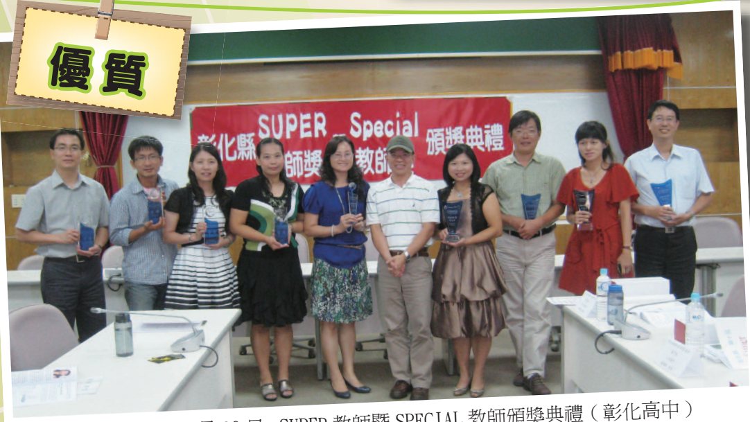
101年9月26日 - SUPER 教師暨 SPECIAL 教師頒獎典禮 (彰化高中)