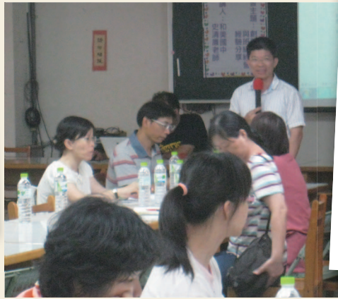
101年5月16日 - SUPER 創新教學與班級經營經驗分享 (社頭國中)