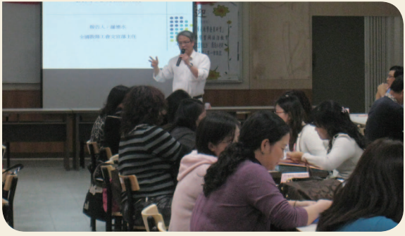
101年3月7日 - 服務學習與法治教育 (民生國小)