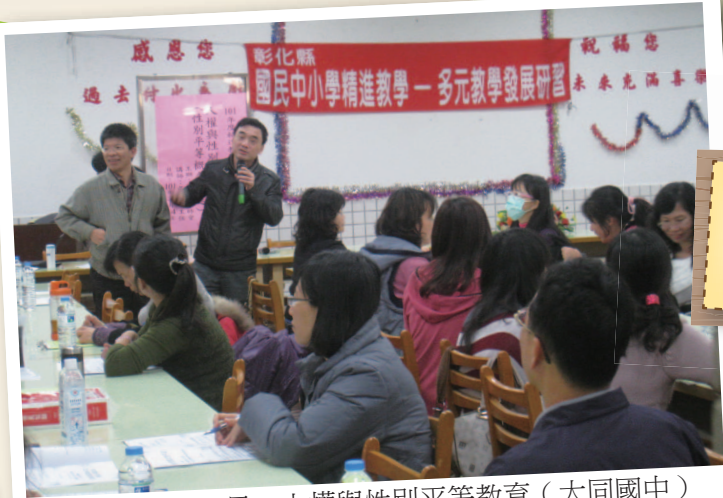
101年3月14日 - 人權與性別平等教育 (大同國中)