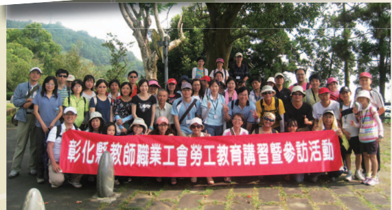
101年7月5日 - 勞動教育研習參訪 ~ 南投縣教育產業工會 (南投日月潭環湖步道)