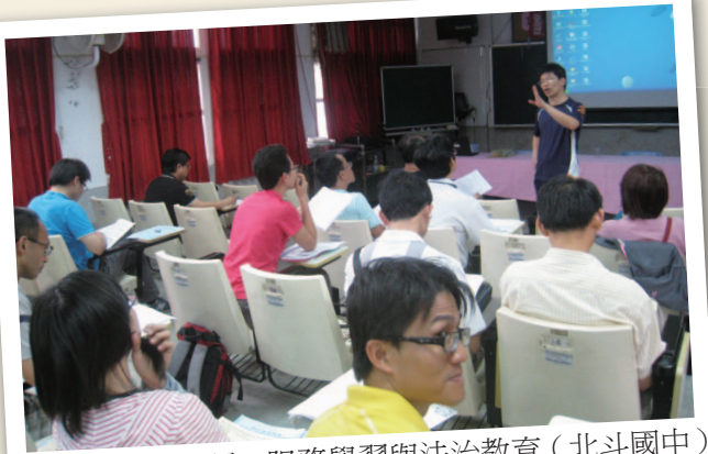
101年4月25日 - 服務學習與法治教育 (北斗國中)