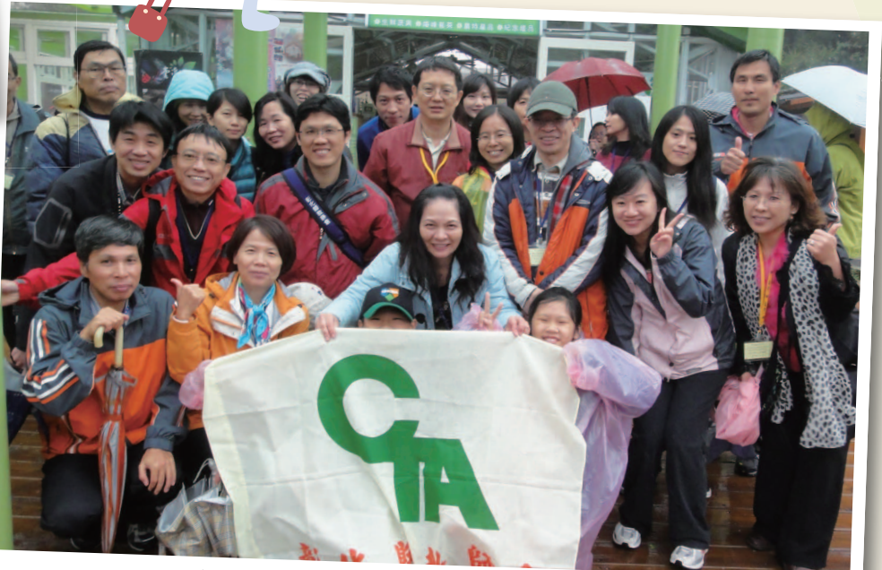
101年11月24日 - 會員聯誼 (台大梅峰農場)