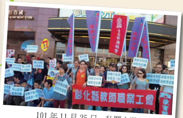
101年11月25日 - 秋鬥大遊行 (台北新光三越站前店)