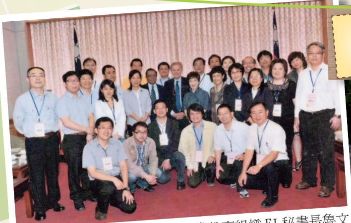
101年4月30日 - 副院長與國際教育組織 EI 秘書長魯文及 EIAP 主任馬修交流 (立法院)