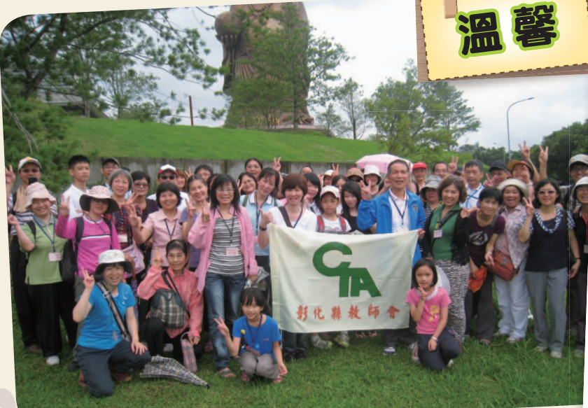
101年6月16日 - 北埔會員聯誼 (峨眉湖)