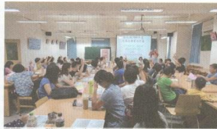
學習力提升工作坊