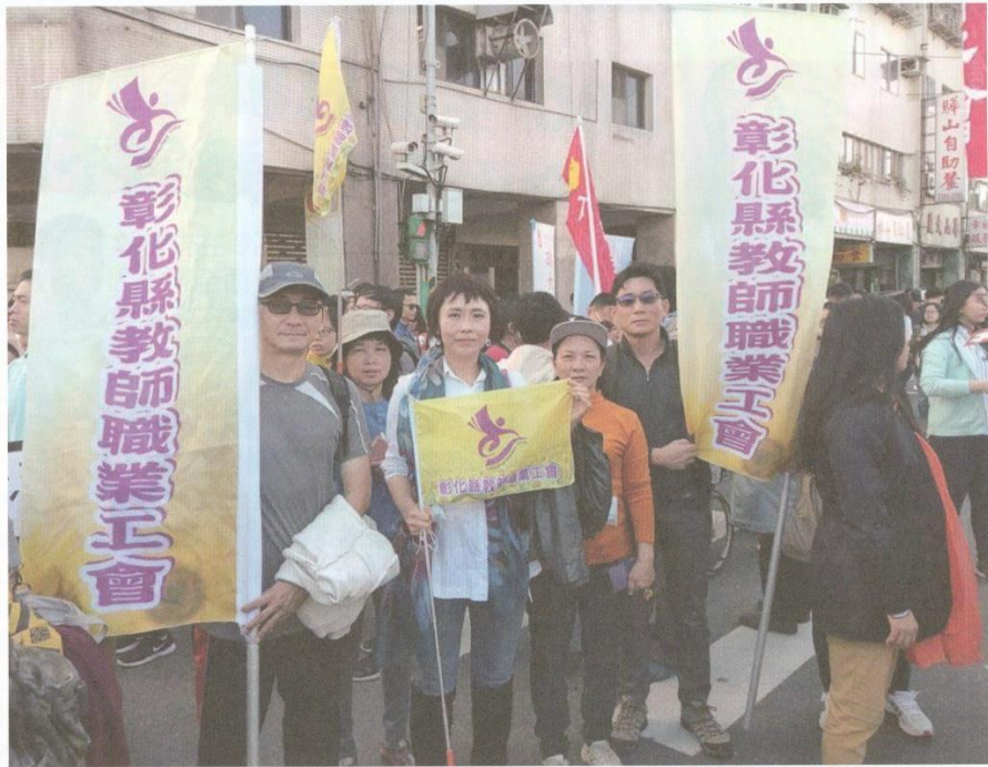
12月23日參加反對勞基法修惡遊行